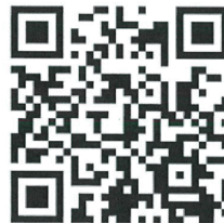
せんもんがっこう よみうりじ どうしゃだいがっこう 専門学校 読売自動車大学校