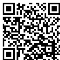
よみうりりこう いりょうふくし せんもんがっこう 読売理工医療福祉専門学校